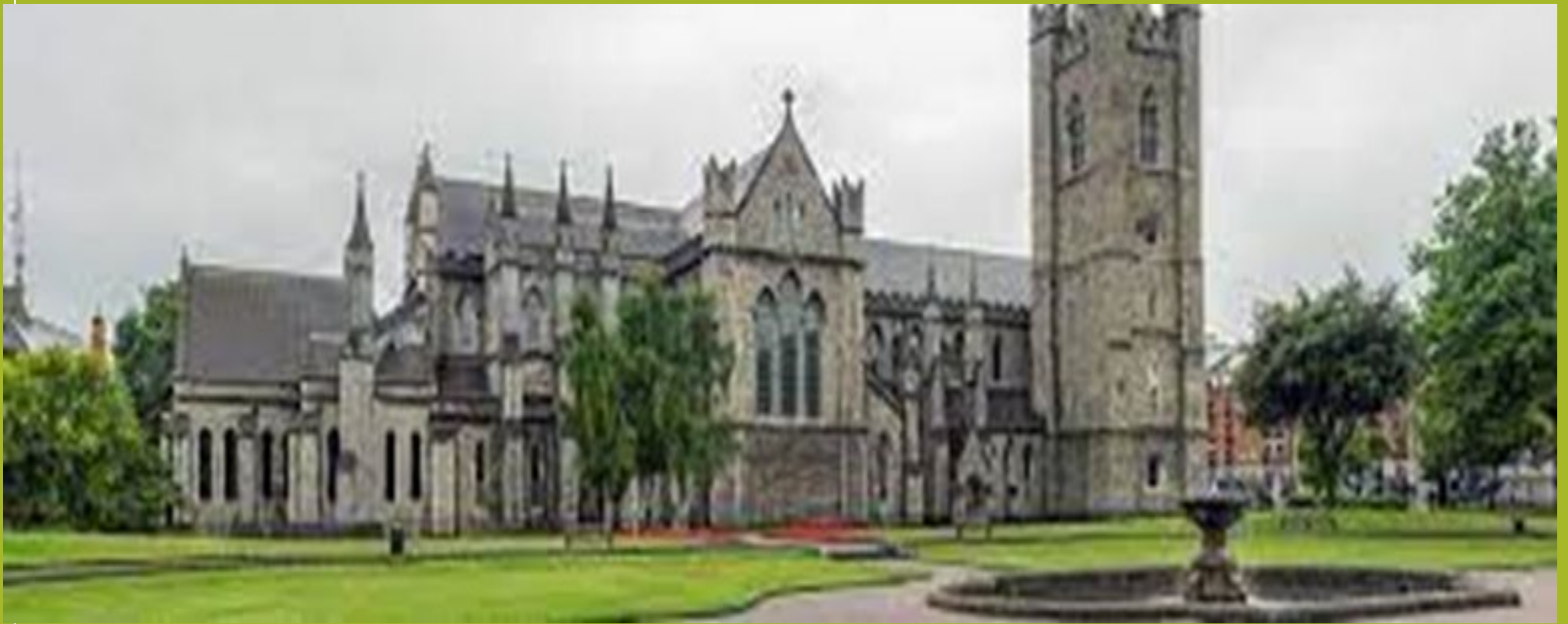
ST PATRICK'S CATHEDRAL